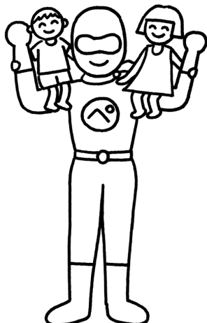
図1 ペアレレンジャー

スタッフの職種は医師，作業療法士，言語聴覚士，心理療法士，児童指導員，保育士で，多職種のスタッフがチームで運営にあたっている。